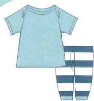
薄い生地、乳幼児用の肌着